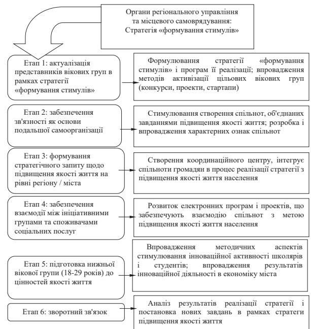
Рис. 3. Стратегія «формування стимулів» в рамках державного механізму управління якістю життя населення (окремі вікові групи)

Система застосування інструментарію являє собою набір узгоджених дій, що отримав назву 6Е (рис. 2).